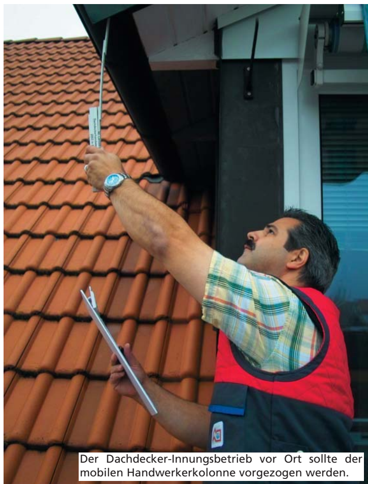
Der Dachdecker-Innungsbetrieb vor Ort sollte der mobilen Handwerkerkolonne vorgezogen werden.

Der Dachdecker in der Nähe bietet dem Auftraggeber viele Vorteile